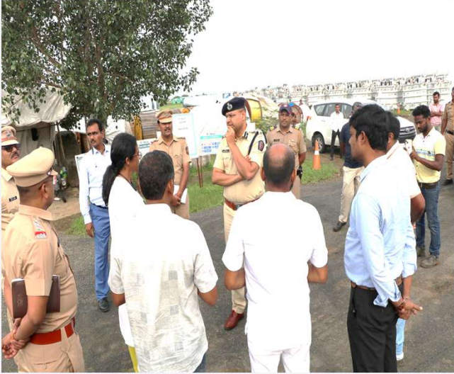
परिक्षेत्रातील पवनऊर्जा प्रकल्प भेट