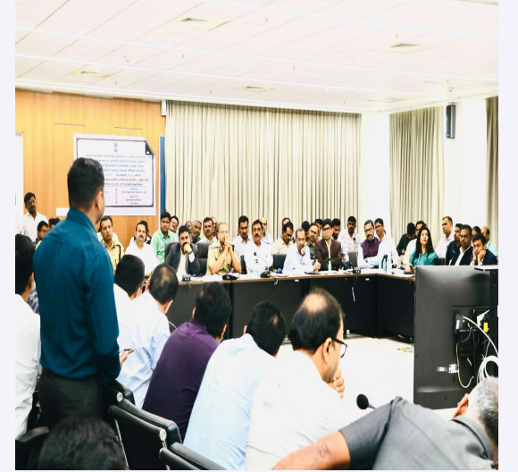
सौरऊर्जा / पवनऊर्जा प्रकल्प अधिकारी बैठक